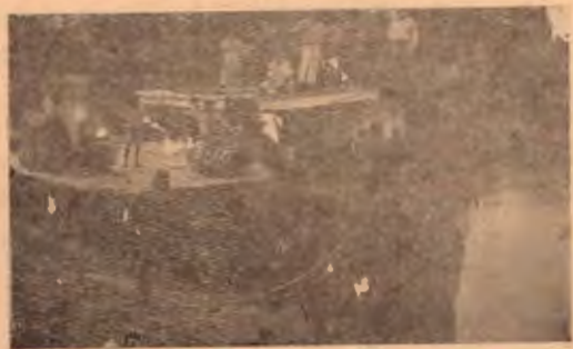
La Lancha Miravalles atracando al muellecito de Bebedero en Guanacaste.