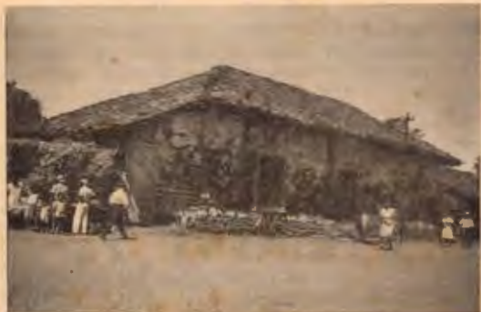
Casa centenaria de Nicoya