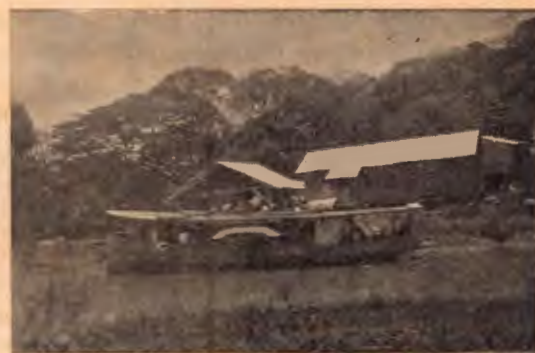
Llegada de la lancha correo al puertecito de Bolsón