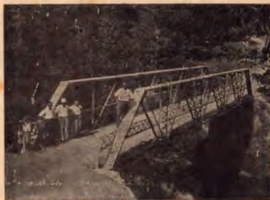
Puente de la Mansión Nicoya. En la Mansión recidió Maceo con un grupo de exilados cubanos.