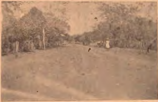
Salida del puertecito de Bebedero a Bagaces en Guanacaste.