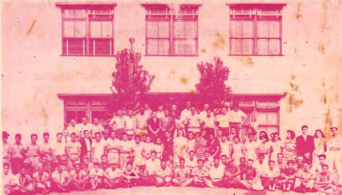
Parte del Personal de la Fábrica de Aceites de Alajuela, frente al edificio donde está la Refinería, Laboratorio y oficinas locales.