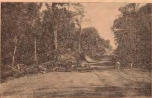
Trocha de la Carretera Panamericana en su entronque con el camino a la finca La Irma en Guanacaste. Muchos millones costaron esos trabajos, sin que la obra responda al enorme esfuerzo hecho ni al dinero invertido defraudando los anhelos de progreso de estos pueblos.