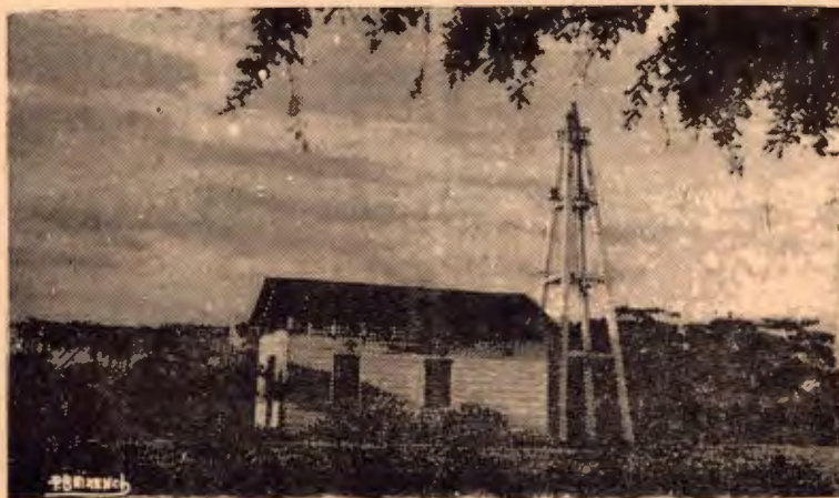
Antigua Ermita a la Virgen del Mar en "La Punta" y faro en el Barrio del Carmen.

Las corrientes han socabado el terreno dándole otra conformación a ese sector y ahora hay un cambio en todo.